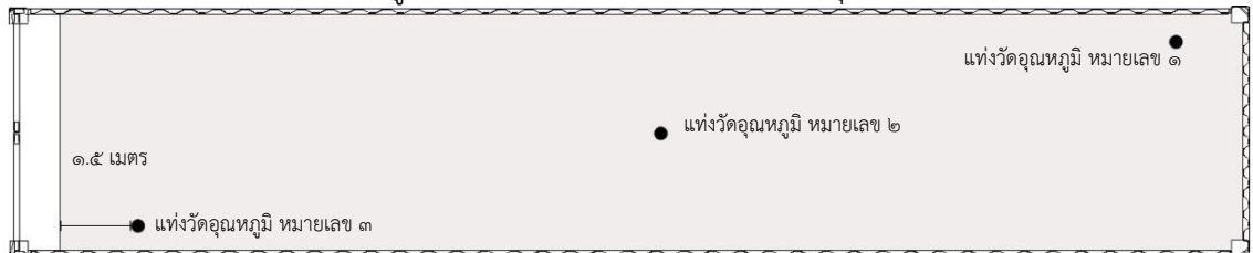
ภาพที่ ๑ ตำแหน่งการวางถังวัดอุณหภูมิผลไม้ภายในตู้ขนส่งสินค้าสำหรับการกำจัดศัตรูพืชด้วยความเย็นระหว่างขนส่ง