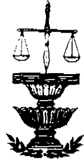
เครื่องหมายสังกัด