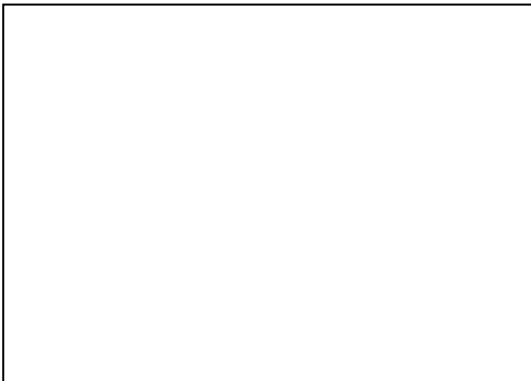
ภาพด้านซ้าย