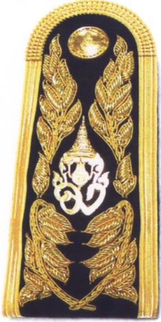
รูปแบบที่ ๒ อินทรรณู