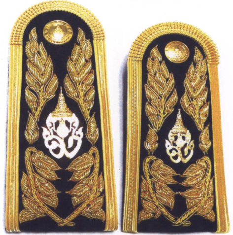
รูปแบบที่ ๕ อินทรรณูชายและหญิง